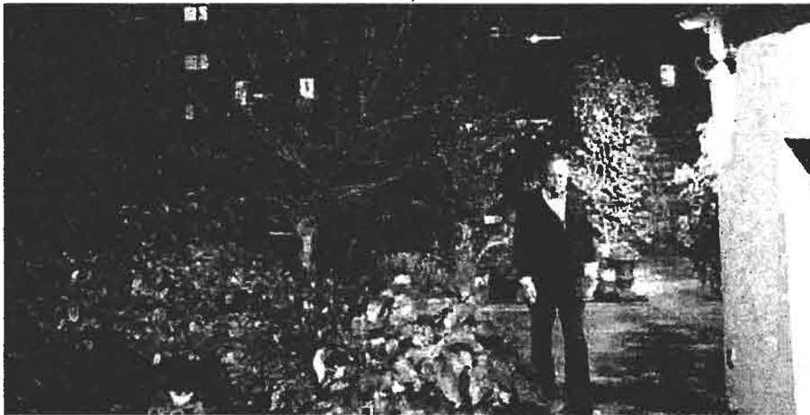
Wer kommt zu Besuch? Die Überwachungskamera liefert passable Bilder.

Die fehlende Drahtlosanbindung und der Kabelwirrwarr sind der einzige Minuspunkt einer sonst rundum überzeugenden Lösung. Wir nahmen schließlich einen Powerline-Adapter, um die Entfernung zum Router zu überbrücken. Aber dann braucht man gleich zwei Steckdosen am Ort der Kamerainstallation.